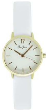
J33585-DC7 Analogo Cuero