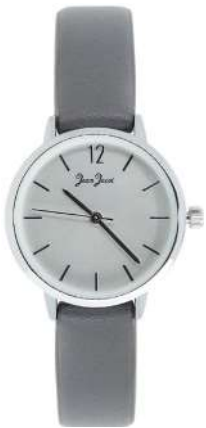
J33584-AC8 Analogo Cuero