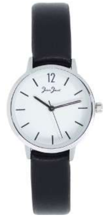
J33583-AC1 Analogo Cuero