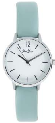
J33582-AC3 Analogo Cuero