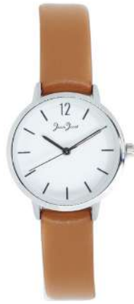
J33581-AC5 Analogo Cuero