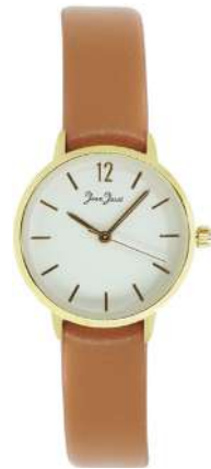
J33586-DC5 Analogo Cuero