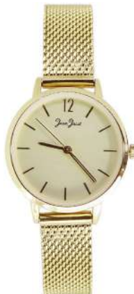
J33590-DMM Analogo Acero