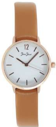
J33588-RC5 Analogo Cuero