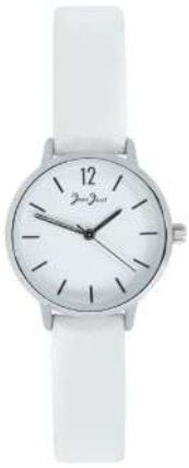
J33580-AC7 Analogo Cuero