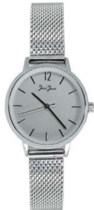
J33589-AMM Analogo Acero