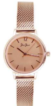
J33591-RMM Analogo Acero