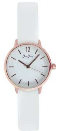
J33587-RC7 Analogo Cuero